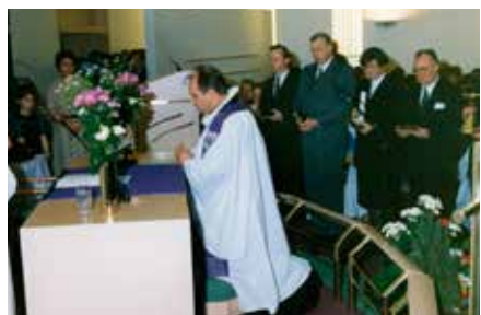
Frá vígslu neðri hæðar Grafarvogskirkju 12. desember 1993

Neðri hæð kirkjunnar var vígð þann 12. desember árið 1993. Gífurleg breyting varð eðlilega á öllu safnaðarstarfinu við vígsluna. Á neðri hæð kirkjunnar fór allt