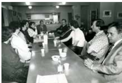
Fyrsti fundur sóknamefndar með prestshjónunum

í tveimur skólum í sókninni, Foldaskóla og Hamraskóla. Samvinna við skólayfirvöld og kennara var einstaklega farsæl og blessunarrík og fyrir það ber að þakka.