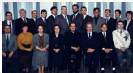
Fyrsta sóknamefnd Grafarvogskirkju

Í Logafold, safnaðarblaði Grafarvogssóknar, sem kom út fyrir síðustu jól, greindi ég frá því að Grafarvogssöfnuður héldi upp á 25 ára afmæli sóknarinnar á þessu ári, árinu 2014. Sóknin var stofnuð þann 5. júní árið 1989.