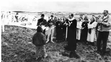
Fyrsta skóflustunga að Grafarvogskirkju

Mikill og sterkur andi frumherjanna, frumkvöðlanna, skapaðist fljótt í sókninni. Fyrsta sóknamefndin var kjörin 1989 og var hún ásamt sóknarpresti í fararbroddi við að „ýta starfinu úr vör.“ Strax í upphafi starfsins var aðaláherslan lögð á það að söfnuðurinn eignaðist sem fyrst sína starfsaðstöðu, sína eigin kirkju.