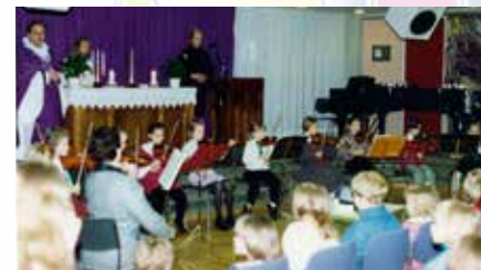
Barnamessa í Félagsmiðinni Fjörgyn í Foldaskóla

haldnir í kirkjunni gegnum árin. Bænahópur hefur starfað á sunnudagskvöldum. Sorgarhópar hafa verið starfræktir sem og hjónabandshópar sem hafa borið nafnið „Að lifa í sátt og samlyndi.“