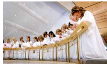
Fermingarbörn frammi fyrir altarinu

Barna- og æskulýðsstarf og ekki síst allt starfið í kringum fermingarbörnin hefur því mótað kirkjustarfið í gegnum árin. Fystu 3 árin fóru fermingar í sókninni fram