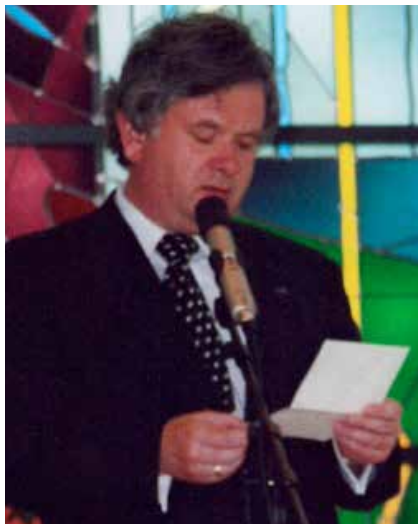
Fv. forsætisráðherra Davíð Oddsson afhendir listaverkið Kristnitakan árið 1000 við vígslu kirkjunnar árið 2000. Gjöfin er tileinkuð æsku landsins

Við vígsluna, en kirkjan var vígð af þáverandi biskupi Íslands, Herra Karli Sigurbjörnssyni, afhenti þáverandi forsætisráðherra Davíð Oddsson kirkjunni