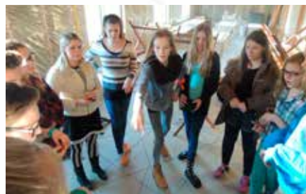
Félagar úr Æskulýðfélaginu

Æskulýðsfélag Grafarvogskirkju var stofnað í upphafi safnaðarstarfsins og hefur starfað með glæsibrag í gegnum árin. Í dag stjórnar æskulýðsfulltrúi Grafarvogskirkju æskulýðsstarfinu.