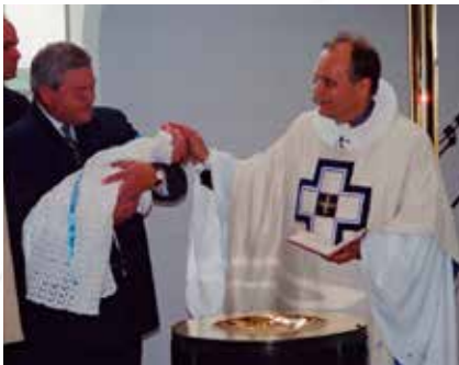
Fyrsta skírmin í nývígðri Grafarvogskirkju 18. júní árið 2000

Eftir vígslu kirkjunnar þann 18. júní á árinu 2000 fjölgaði athöfnum í kirkjunni til muna og má segja að í dag fari athafnir fram í kirkjunni meira og minna alla daga vikunnar.