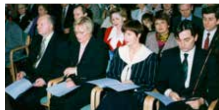
Arkitektar og formaður byggingarnefndar við víslu neðri hæðar Grafarvogskirkju

Því var ákveðið að efna til samkeppni með kirkjubyggingu. Haft var samband við margar arkitektastofur í borginni og þær beðnar um að taka þátt í samkeppni með kirkjubyggingu í hverfinu.