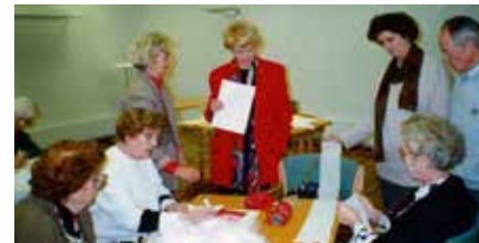
Þáverandi forseti Íslands frú Vigdís Finnbogadóttir heimsækir eldri borgara

Æskulýðsfélag Grafarvogskirkju var stofnað í upphafi safnaðarstarfsins og hefur starfað með glæsibrag í gegnum árin. Í dag stjórnar æskulýðsfulltrúi Grafarvogskirkju æskulýðsstarfinu.