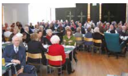
Þoraglegði eldri borgara

Safnaðarstarfið hefur svo sannarlega verið og er fjölbætt. Foreldramorgnar hafa verið